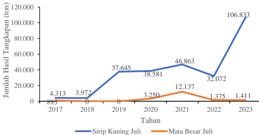
Gambar 4. Hasil Tangkapan Ikan Tuna Bulan Juli Tahun 2017-2023

Hasil tangkapan ikan Tuna Sirip Kuning dan Mata Besar dari bulan Juli tahun 2017 hingga 2023 menunjukkan fluktuasi yang signifikan berdasarkan data penelitian yang dilakukan di Pelabuhan Perikanan Samudera Bungus. Data lengkap untuk bulan Juli tahun 2017-2023 dapat dilihat pada Gambar 4.