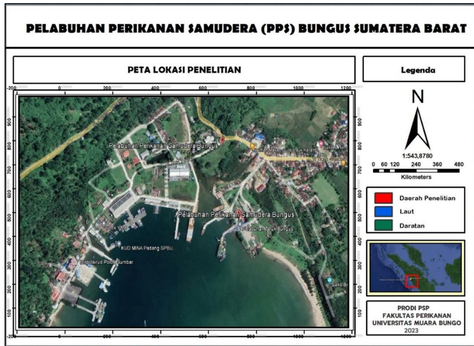
Gambar 1. Peta Lokasi Penelitian (Google Maps)

Teknik pengumpulan data dilakukan dengan dua cara yaitu primer dan sekunder, secara rinci sebagai berikut: