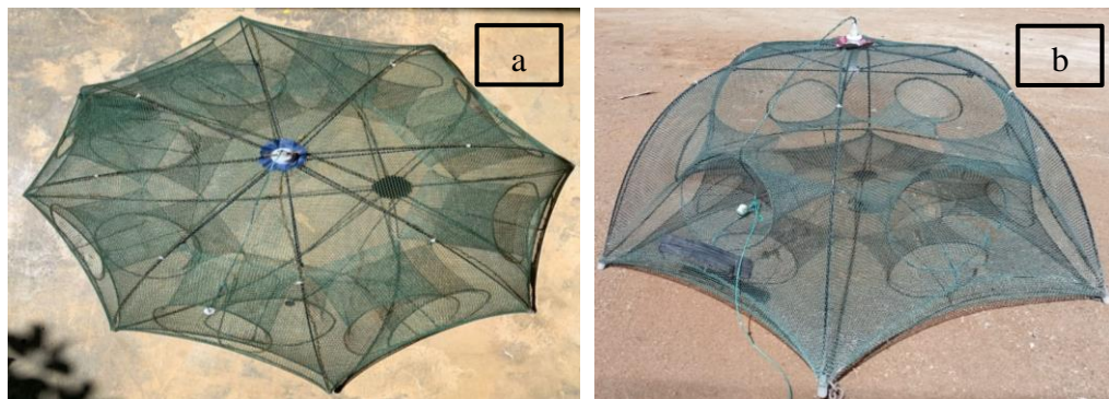
Gambar 2. Konstruksi Bubu Lipat Payung a. Funnel 8 dan b. Funnel 6

tulis, meteran, timbangan, handphone android, termometer dan secchi disc . Hasil tangkapan merupakan bahan penelitian.